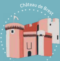
Château de Brest